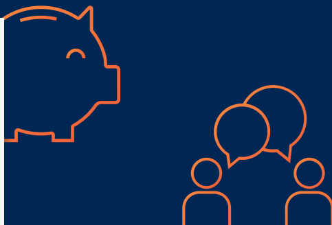
Immagine migliorata grazie alla sostenibilità

L'esperienza lo dimostra: con semplici misure immediate, è possibile ridurre i costi energetici dell'azienda del 10-15% e risparmiare da 3000 a 45 000 franchi all'anno, a seconda delle dimensioni dell'azienda, senza bisogno di grandi investimenti.