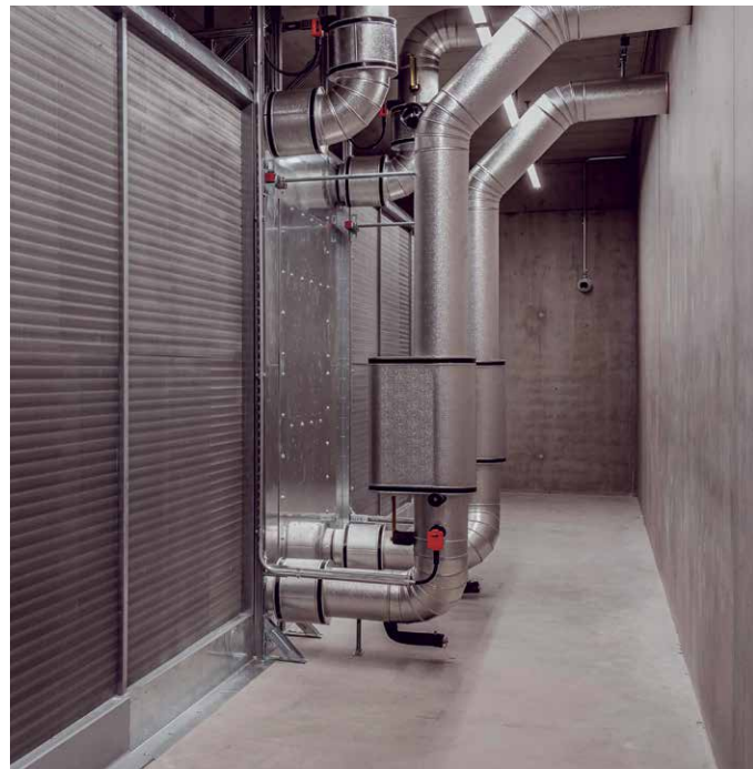
Vista dello scambiatore di calore aria-acqua, il quale trasferisce il calore dall'aria riscaldata a un circuito idraulico che lo trasporta alla centrale di teleriscaldamento. Qui il calore funge da fonte di energia per alimentare le pompe di calore. Queste innalzano la temperatura per permettere alla rete di teleriscaldamento di utilizzare il calore.

L'apporto di calore supplementare del centro di calcolo sostituisce una parte del calore, attualmente ancora generato da caldaie a gas nella rete esistente, e riduce così le emissioni di CO 2 .