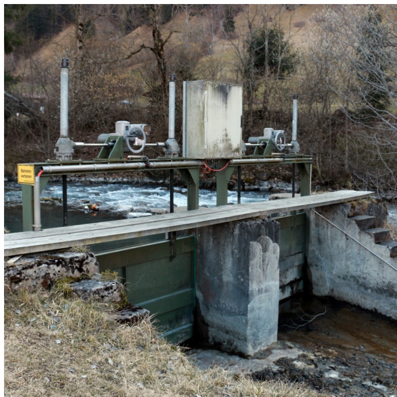
Fassung KW Schiefertafelfabrik Frutigen

La tradizionale giornata tecnica sulle piccole centrali idrauliche organizzata da Swiss Small Hydro avrebbe dovuto svolgersi il 9 maggio 2020 a Wimmis/Spiez, presso BKW Energie AG. A causa della situazione attuale dovuta al coronavirus la giornata è stata