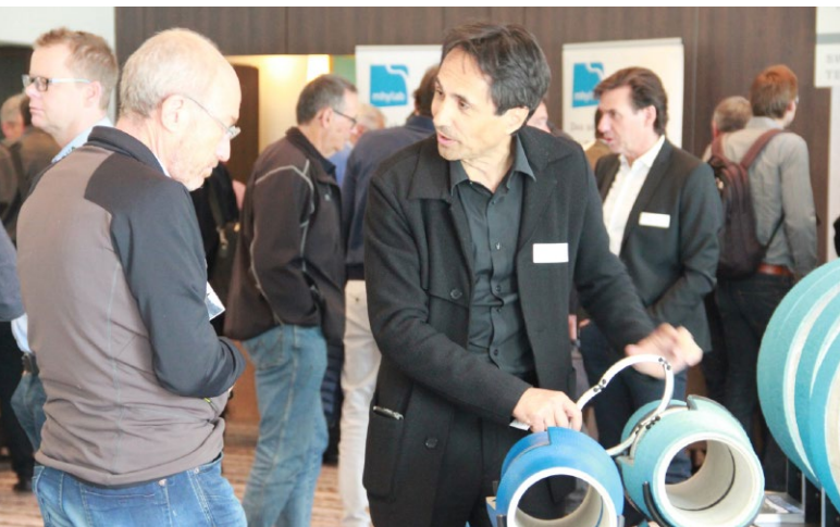
Discussions techniques dans l'espace-exposant

recherche sur la dévalaison des poissons, projet mené, notamment, par le VAW, laboratoire en génie hydraulique, hydrologique et glaciologique de l'ETHZ, Ecole polytechnique fédérale de Zurich.