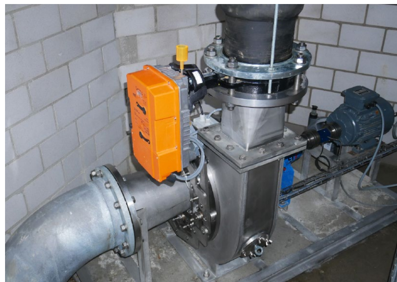
La turbine PAT-Francis

En collaboration avec les fabricants de pompes EGGER et de mini-turbines REVITA, l'ingénieur J-M. Chapallaz a développé un prototype de turbine PAT-Francis, récemment mis en service, et actuellement en phase de test sur un site pilote soutenu par la Confédération . La turbine PAT Francis est une pompe, fonctionnant en mode turbine, équipée d'une bêche spirale et d'un distributeur de type Francis. Ainsi, il est possible d'exploiter la machine sous des débits variables, ce qui n'est pas le cas d'une pompe inversée. Les applications potentielles sont notamment pour des sites de dotation, de petits cours d'eau, canaux d'irrigation, réseaux d'eau potable et récupération d'énergie dans des processus industriels.