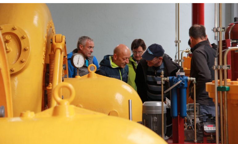
Visite de la centrale électrique du Chanet

La prochaine rencontre de SSH aura lieu le 9 mai 2020 dans la région de Berne, en Suisse centrale.