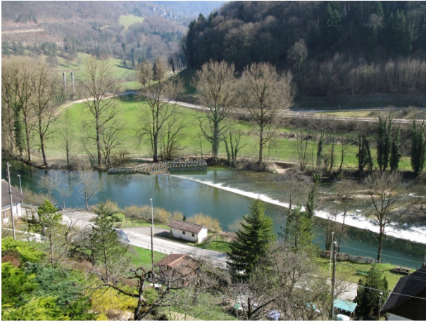
Photomontage du projet de passe à poissons prévu sur le Doubs à Saint-Ursanne (JU)