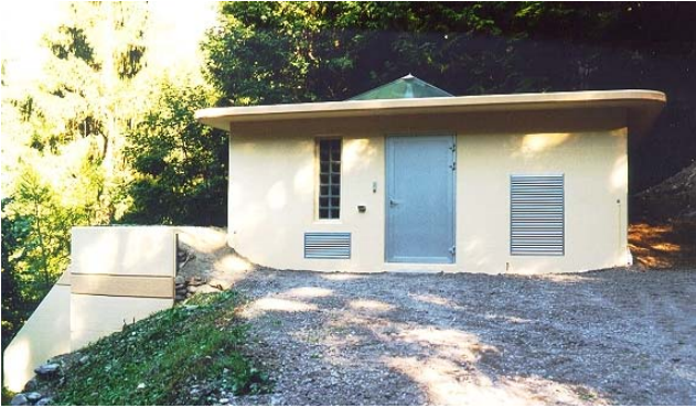
La centrale de La Rasse, installée sur le réservoir d'eau potable des communes de St-Maurice et Evionnaz

Sur la base de ces hypothèses, il apparaît que la centrale de La Rasse émet 0.5 g de CO 2 par kWh, soit environ 7 fois moins qu'une production hydroélectrique classique au fil de l'eau et plus de 1000 fois moins qu'une production d'électricité issue d'énergie fossile, comme une centrale à gaz ou à charbon.