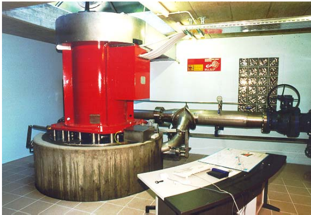
Le turbogénérateur de 750 kW de La Rasse, à deux injecteurs

Enfin aujourd'hui c'est grâce, en bonne partie, aux projets sur les réseaux d'eau potable que se développe le potentiel installé de la petite hydraulique. En effet, comme ce sont des projets qui ne posent que peu de problèmes administratifs, le processus de décision est rapide. Leur aspect a priori simple techniquement ne doit toutefois pas conduire à négliger la qualité des équipements et la maximisation de la production sur le long terme, clé d'un cycle de vie optimal en terme environnemental.