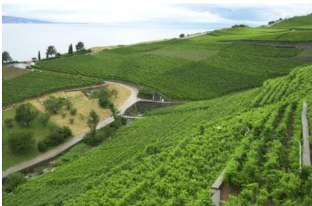
Le Lavaux, région à haute valeur patrimoniale et énergétique, préservée par la pose d'une conduite en forage dirigé pour le projet Rivaz II (Q = 500 l/s, Hn = 178 m, Pe = 750 kW)