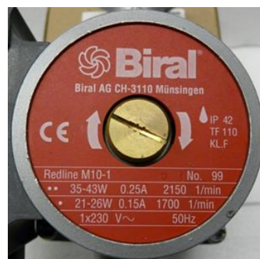
Figure 2 : Plaque signalétique de la pompe

Si une plage de puissance (p. ex. de 35 à 43 W) est indiquée au lieu d'une valeur unique, on peut utiliser la valeur la plus élevée.