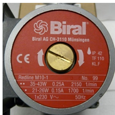
Figure 2: Plaque signalétique de la pompe, source: Biral Redline M10-1

Si une plage de puissance (par ex. de 35 à 43 W) est indiquée au lieu d'une valeur unique, on peut utiliser la valeur la plus élevée.