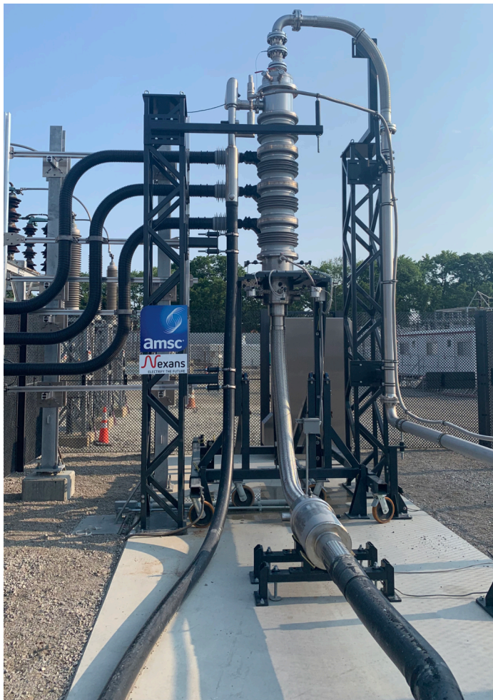
Photo du projet de câble HTS à Chicago, dans l'État américain de l'Illinois.