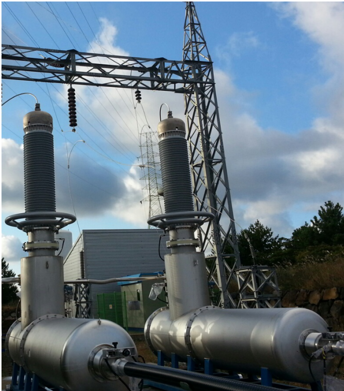
Point final d'un câble supraconducteur à courant continu d'une tension de 80 kV en Corée du Sud.

nique à grande échelle. En tant qu'entreprise industrielle produisant des tableaux de distribution et des transformateurs, nous suivons cette évolution de très près, car si la technologie supraconductrice s'impose, elle a un potentiel de changement massif pour l'ensemble de l'approvisionnement en énergie électrique».