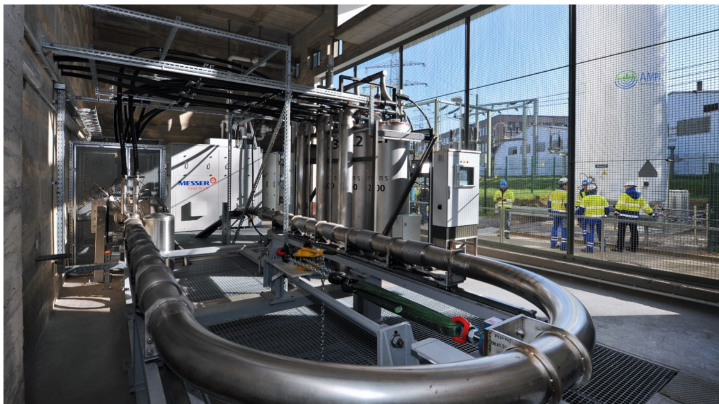
Photo du câble supraconducteur de 10 kV utilisé dans le centre-ville d'Essen d'avril 2014 à mars 2021. Ce projet innovant a suscité un vif intérêt de la part du public. Au cours des sept années, le transport de l'électricité s'est déroulé presque sans interruption et pratiquement sans perturbation, mais l'exploitation économique n'a pas été atteinte pendant le test pratique. À l'extérieur du bâtiment, à droite, se trouve le réservoir contenant le liquide de refroidissement, l'azote.

Les supraconducteurs à haute température ont été découverts dans les années 1980. Depuis, des experts débattent sur l'utilisation commerciale de leurs caractéristiques dans l'alimentation électrique. Entre-temps, des champs d'application concrets se dessinent, dans lesquels les câbles électriques sans résistance et d'autres composants de réseau supraconducteurs peuvent faire valoir leurs avantages. Une feuille de route du programme international «Assessing the impacts of high-temperature superconductivity on the electric power sector» de l'Agence internationale de l'énergie, à laquelle des experts suisses ont largement contribué, présente les domaines d'application de cette technologie à court, moyen et long terme.