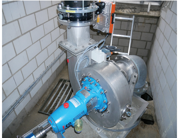
Dans le cadre du projet PaT-Francis, une pompe à eaux usées est utilisée en tant que turbine Francis. Ce type de machine est adapté pour les centrales hydroélectriques avec une puissance et une hauteur de chute moindres.

Grâce à ces mesures et à d'autres, environ 2,5 kW électriques issus de la puissance hydraulique brute de 4,0 kW sont disponibles pour alimenter le réseau, comme le montrent les données d'exploitation disponibles à ce jour. Le rendement de la turbine PaT Francis s'élève à 75% maximum (cf. figure p. 4) et le rendement électrique (générateur, convertisseur de fréquence avec unité d'alimentation) à 84%; ce dernier est relativement modeste en raison des composants et filtres de réseau nécessaires pour la qualité de l'alimentation. « Avec un rendement global de 63% (puissance électrique par rapport à la puissance hydraulique brute), cette petite centrale se situe à environ 20 points de pourcentage en dessous d'une centrale hydroélectrique de grande puissance », explique M. Eichenberger. « Les machines PaT-Francis plus grandes à partir d'une puissance de 10 kW peuvent permettre un rendement pouvant atteindre et dépasser 70%. »