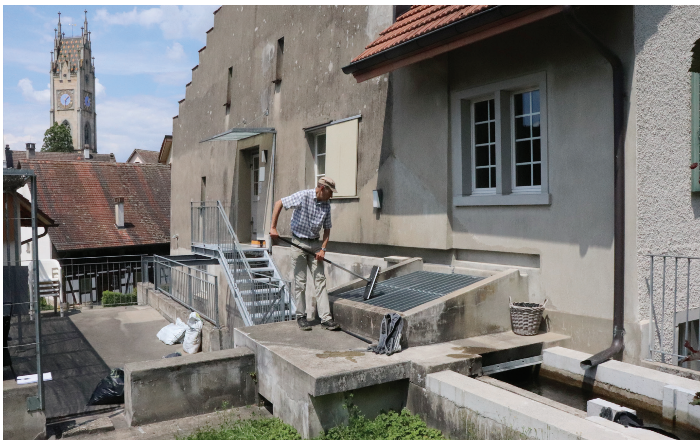
Obermühle à Andelfingen: le Mülibach (à droite) est utilisé pour la production d'électricité dans une petite centrale hydroélectrique. Peter Eichenberger nettoie l'entrée de temps en temps. Une grille grossière permet aux petits mammifères tels que les souris et les hérissons de sortir du canal, une plaque perforée protège les poissons.

L'alimentation électrique décentralisée a de multiples visages. Les petites et microcentrales hydroélectriques en sont une variante. Une exploitation rentable est possible lorsque les installations peuvent être construites à moindres coûts. Un nouveau concept utilise une pompe modifiée qui, fonctionnant en sens inverse, est utilisée comme une turbine Francis (désignation : concept PaT-Francis). Une microcentrale hydroélectrique de ce type est en service à Andelfingen dans le canton de Zurich depuis fin 2018. Depuis lors, elle a démontré sa fonctionnalité dans le cadre d'un projet pilote de l'OFEN.