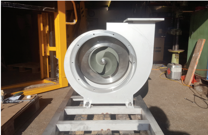
Vue de l'intérieur de la turbine sur la roue ouverte à deux aubes .