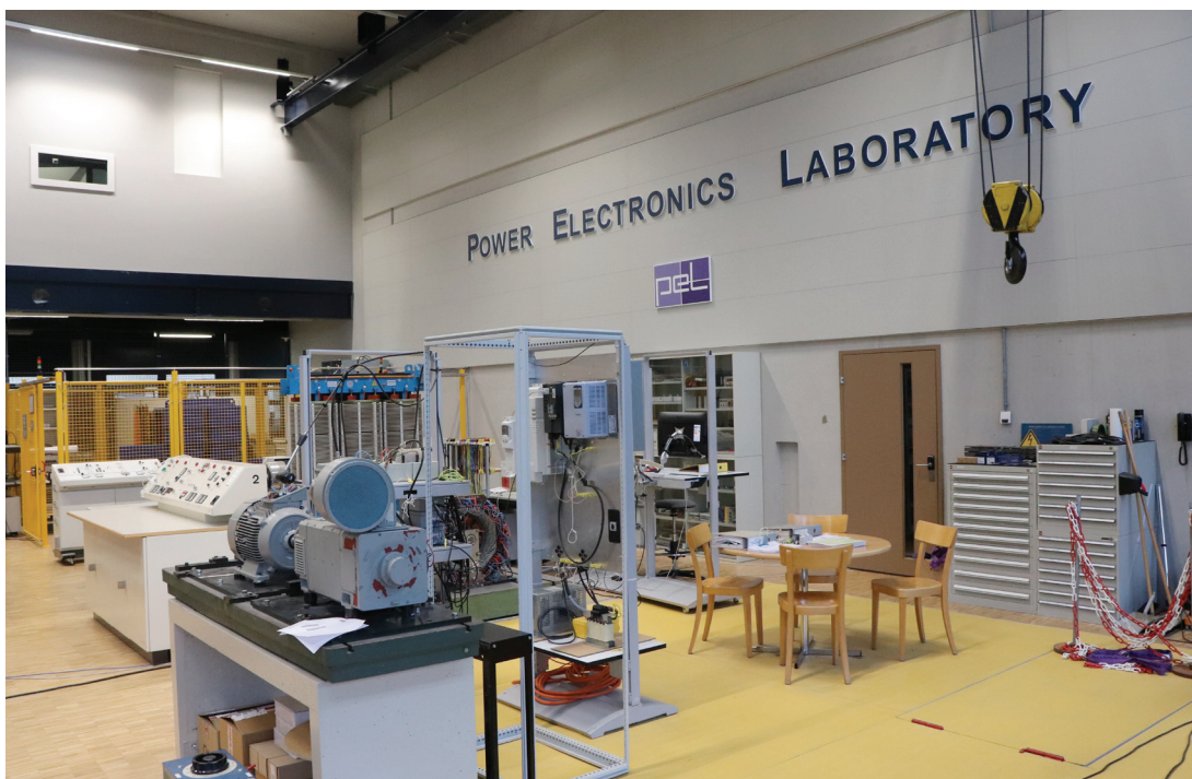
Vue dans le laboratoire d'électronique de puissance à l'EPFL.

Le courant continu est aujourd'hui principalement utilisé à basse tension. Cependant, le courant continu est également de plus en plus utilisé au niveau de la moyenne tension (1,5 à 50 kV), par exemple pour l'alimentation de systèmes de télécommunication, de centres informatiques ou de navires, lesquels consomment jusqu'à 30% de diesel en moins grâce à l'abandon du courant alternatif. A l'avenir, les réseaux de moyenne tension pourraient être utilisés pour rassembler l'électricité produite par plusieurs systèmes photovoltaïques ou par un grand nombre de centrales éoliennes sur un seul point avec de faibles pertes avant que le courant continu ne soit converti et injecté sur le réseau de courant alternatif. Avec le courant continu, les réseaux de moyenne tension exploités pourraient également intervenir pour l'aménagement de quartiers complets ou de zones industrielles. Sur le campus universitaire de la ville allemande d'Aachen, un réseau