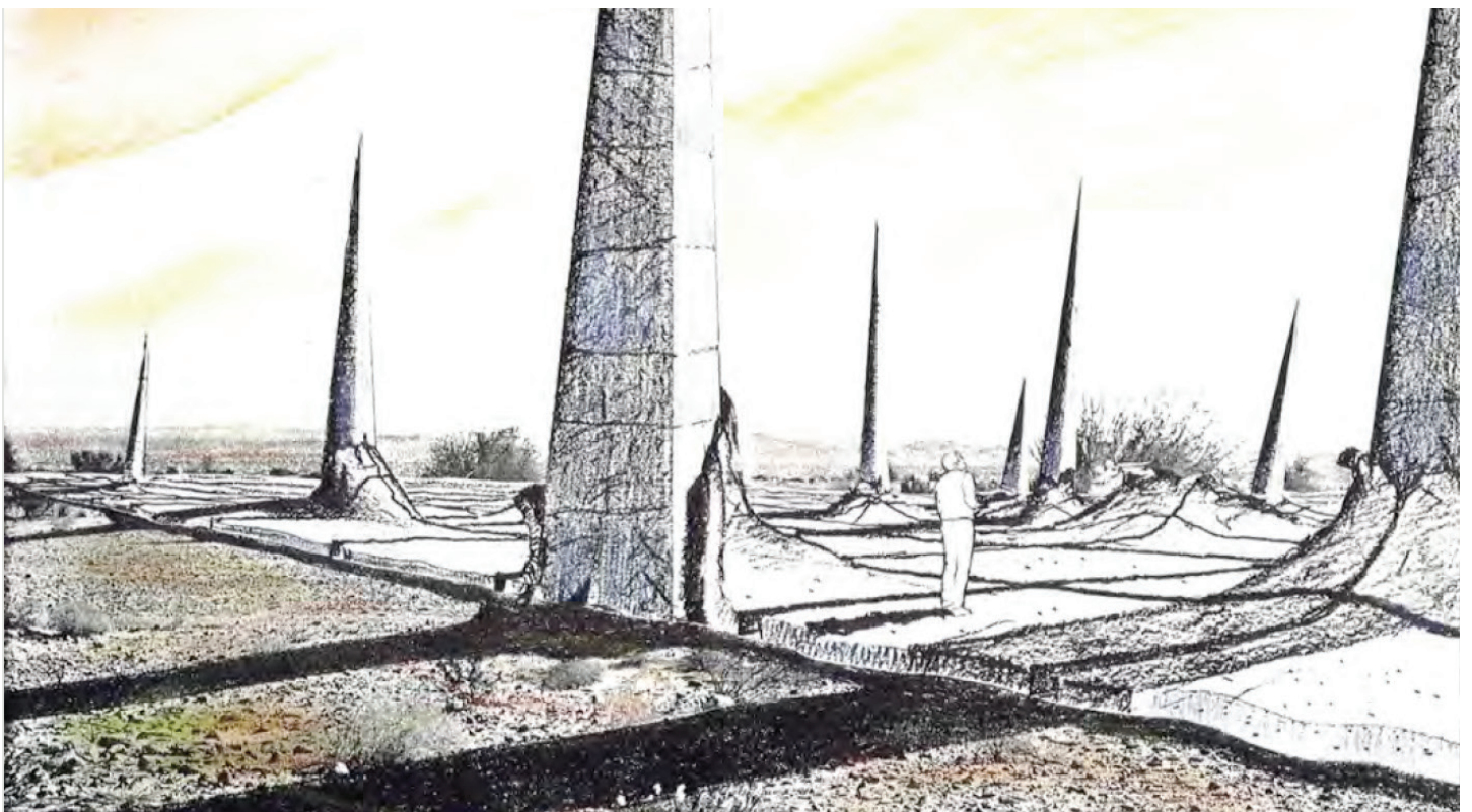
Ein bedrohlich gestaltetes Nadelfeld («Spike Field») – so eine Vorstellung aus dem späten 20. Jahrhundert – könnte die Menschen von Endlagerstätten für Atomabfälle fernhalten. Illustration: Dokumentation RK&M-Symposium

In der Schweiz stehen drei Standortgebiete für den Bau geologischer Tiefenlager für radioaktive Abfälle in der Diskussion: Jura Ost (AG), Nördlich Lägern (AG, ZH) und Zürich Nordost (TG, ZH). Die Orte, wo die Lagerstätten am Ende gebaut werden, sollen nach heutiger Auffassung über eine sehr lange Zeit erkennbar bleiben, und das Wissen rund um die Tiefenlager über Tausende von Generationen weitergegeben werden. Wie das gelingen kann, skizziert nun eine Expertengruppe der Organisation für wirtschaftliche Zusammenarbeit und Entwicklung (OECD) in einem Bericht, der im Herbst veröffentlicht wird. Fachleute und Vertreter der Standortregionen haben die Vorschläge und ihre Folgen für die Schweiz Anfang September 2019 an einer Tagung im Kunsthaus Zürich diskutiert.