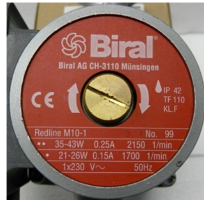
Abbildung 2: Typenschild Pumpe

Falls an Stelle einer Leistungsangabe ein Leistungsbereich (z.B. 35 Watt - 43 Watt) angegeben ist, so darf der höhere Leistungswert verwendet werden.