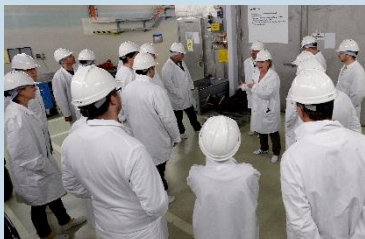
Ausbildungsmodul für Regionalkonferenzen im Zwischenlager Zwiilag.

Die Regionalkonferenzen sind seit Beginn der 2. Etappe aktiv und haben das Verfahren seither massgeblich mitgestaltet. Wie geht es mit ihnen weiter?