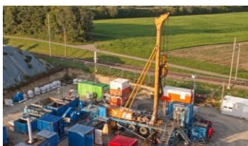
Bohrturm einer Bohrung in Schlattingen.

Mit der 3D-Seismikkampagne wird die Nagra im Herbst 2015 starten. Seismische Untersuchungen können von der Oberfläche her durchgeführt werden. Dabei erzeugen sogenannte Vibrationsfahrzeuge Stösse, die sich ins Erdinnere fortsetzen. Aufgrund der messbaren Reaktionen aus dem Untergrund kann auf dessen Aufbau geschlossen werden. Im Gegensatz zur 2D-Seismik, wo der Untergrund entlang von Geländelinien abgebildet wird, werden bei der 3D-Seismik zusätzlich quer dazu weitere Datenlinien erhoben, so dass ein flächenhaftes Netz entsteht. Eine 2D-Seismikkampagne hatte die Nagra zu Beginn von Etappe 2 durchgeführt (vgl. www.seismik-news.ch ).