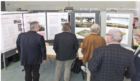
«Treffpunkt Tiefenlager» in Jestetten (D) im November 2014.