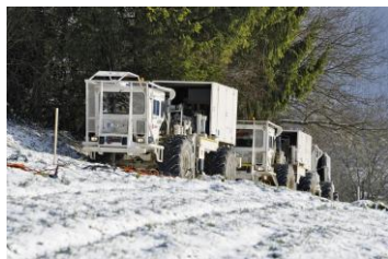
Vibrationsfahrzeuge in Aktion.

In den vorgeschlagenen Standortgebieten Jura Ost und Zürich Nordost wird die Nagra vertiefte geologische Untersuchungen durchführen.