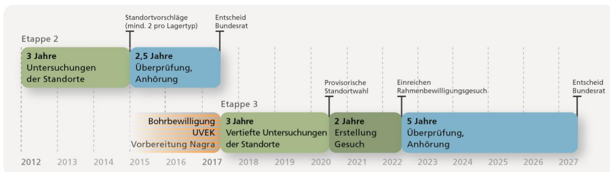
Schematische Darstellung der zweiten und dritten Etappe des Auswahlverfahrens.

Etappe 2: Die Berichte und Analysen der Nagra werden in den kommenden Monaten vom ENSI und der Kommission für nukleare Sicherheit (KNS) sowie weiteren Bundesstellen überprüft . Basierend auf der behördlichen Überprüfung sowie der Stellungnahmen des Ausschusses der Kantone und der Standortregionen nimmt das BFE danach eine Gesamtbeurteilung des Nagra-Vorschlags vor. 2016 werden sämtliche Berichte, Gutachten und Stellungnahmen in eine dreimonatige öffentliche Anhörung geschickt. Der Bundesrat wird unter Kenntnis aller relevanten Fakten voraussichtlich Mitte 2017 über die Standortvorschläge der Nagra entscheiden.