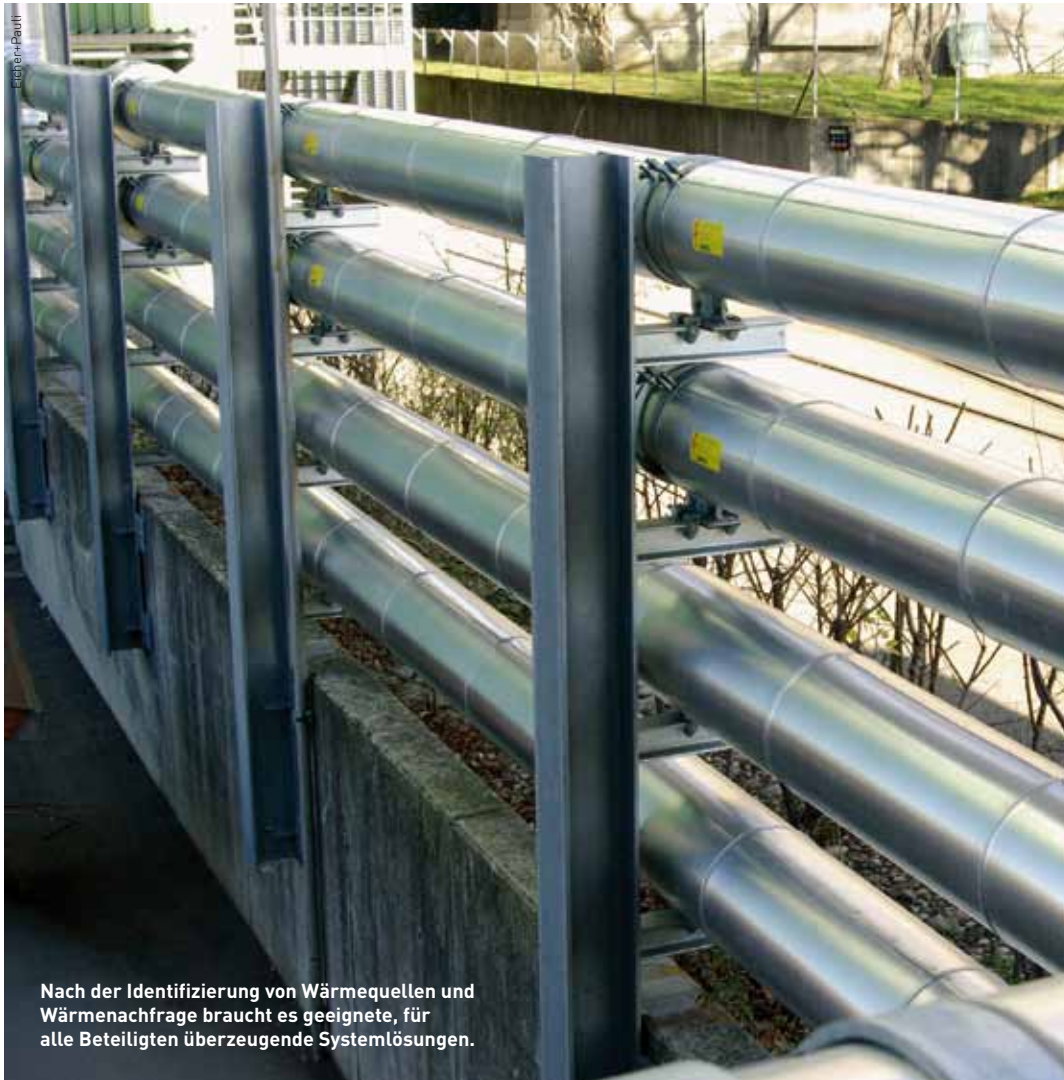
Nach der Identifizierung von Wärmequellen und Wärmenachfrage braucht es geeignete, für alle Beteiligten überzeugende Systemlösungen.

Das Potenzial der Nah- und Fernwärme ist grösser als man meint. Diese Erkenntnis beruht auf Daten, die mit einem neu entwickelten GIS-Werkzeug generiert wurden. Die GIS-Daten zeigen, welche Gebiete hohe Wärmebedarfsdichten und gleichzeitig potenziell verfügbare Abwärme aufweisen.