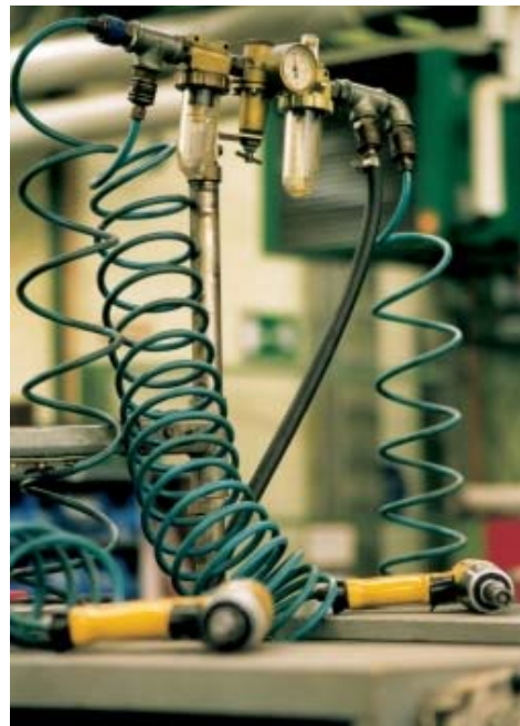
Abb. 3: Energie-„Vernichter“ im Druckluftnetz

Grosse Querschnittstoleranzen, mehr Kupplungen als nötig, zuviel Tüllen und falsche Schlauchdurchmesser summieren sich zu einem grossen Energie-„Vernichter“. Passende Konfektionierung zahlt sich fast immer aus.