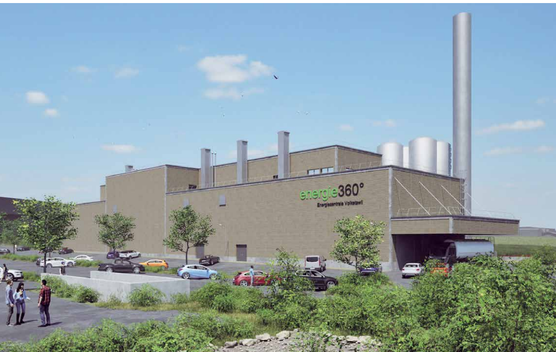
Visualisierung der Energiezentrale, in der ab 2028 die Abwärme der Rechenzentren für die Verteilung im Fernwärmenetz aufbereitet wird.

Im zürcherischen Volketswil entsteht ein neues Fernwärmenetz, das die Dekarbonisierung der Gemeinde voranbringt. Die Energie stammt überwiegend aus der Abwärme von drei neuen Rechenzentren. Das Projekt zeigt: Wird die Abwärmenutzung von Beginn an mitgedacht, entstehen Mehrwerte für alle Beteiligten.