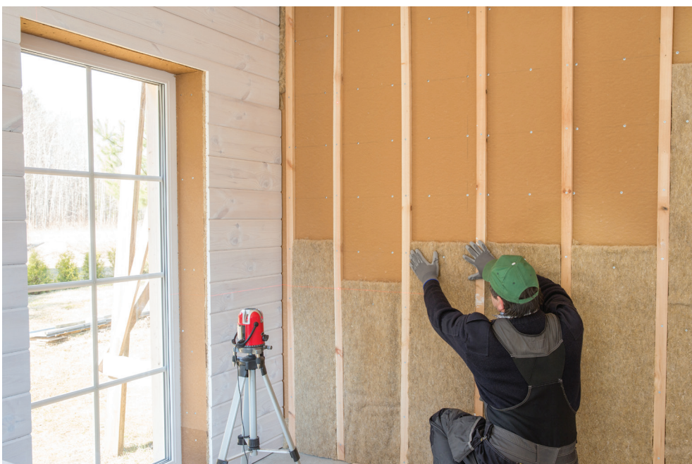
Wärmedämmung mit Holzfaserplatten und Naturhanf.

Aus circa 100 ökologisch vorteilhaften Materialien wurden 30