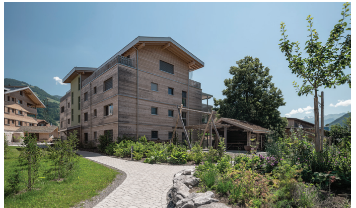
Holz ist ein Baustoff mit einem vergleichsweise kleinen ökologischen Fussabdruck: Mehrfamilienhaus aus Holz bei der Überbauung Unterfeld in Steinen (SZ).

Die Senkung des Energieverbrauchs und der Treibhausgas-Emissionen des Schweizerischen Gebäudeparks ist eine Herausforderung. Die ZeroStrat-Studie bestätigt, dass nach-