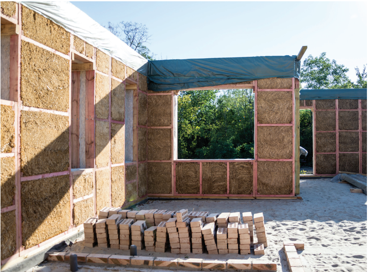
Bau eines Hauses aus umweltfreundlichen, pflanzlichen Materialien: Der Rahmen besteht aus Holz und ist gefüllt mit Strohblöcken.

Wer baut, der setzt Baustoffe und Bauteile ein, zu deren Herstellung mehr oder weniger Energie benötigt wurde. Mit einer bewussten Auswahl der Baumaterialien lassen sich die Treibhausgas-Emissionen bei Neubauten und Sanierungen markant verringern, nämlich um 40 und mehr Prozent. Das zeigt eine aktuelle Studie, die vom Bundesamt für Energie finanziell unterstützt wurde.