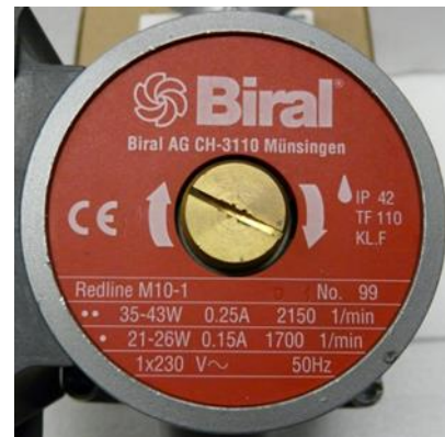
Abbildung 2: Typenschild Pumpe, Quelle: Biral Redline M10-1

Falls anstatt einer Leistungsangabe ein Leistungsbereich (z.B. 35 Watt - 43 Watt) angegeben ist, so darf der höhere Leistungswert verwendet werden.