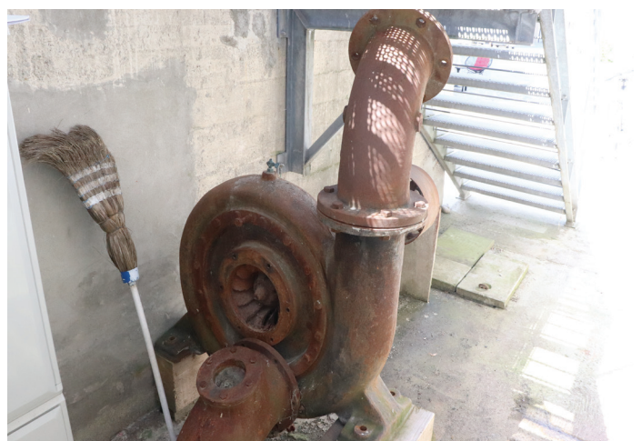
Diese Francis-Turbine trieb von 1941 bis 1972 in der Obermühle in Andelfingen eine Getreidemühle an. Heute wird zur Stromerzeugung derselbe Turbinentyp genutzt, wobei die Francis-Turbine in neuartiger Weise aus einer Pumpe mit angebautem Leitapparat konstruiert ist.

das Laufrad der Pumpe wegen Kavitation (unerwünschter Luftblasenbildung) durch ein solches mit leicht geänderter Geometrie ersetzt werden. 2019 blieb der Stromertrag unter den Erwartungen. Der Mülibach führte nur sehr wenig Wasser, da der Grundwasserstand – die Hauptquelle des Baches – nach dem extrem trockenen Vorjahr sich noch nicht erholt hatte. 2020 kann die angestrebte Jahresproduktion von 12'000 kWh gemäss den bisherigen Erträgen erreicht werden. Das entspricht dem Jahresbedarf von drei Haushalten und ist vergleichbar mit dem Ertrag einer mittelgrossen PV-Anlage.