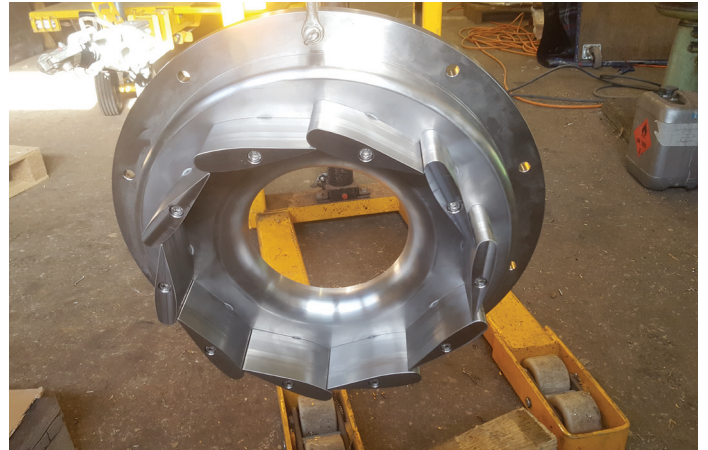
Mit zehn Schaufeln reguliert der Leitapparat die Wassermenge, die auf die Turbine strömt.

Bei Investitionskosten von 80'000 Fr. (ohne Wehranlage – diese wurde durch Beiträge der Gemeinde, Anstösser und Denkmalpflege wieder aufgebaut) und einer Nutzungsdauer von 40 Jahren rechnen die Betreiber unter Berücksichtigung von Betrieb und Unterhalt mit Gestehungskosten von 25 Rp. pro Kilowattstunde (Kalkulationszinssatz 1%; Äufnung eines Erneuerungs- und Ersatzteifonds mit 600 Fr. pro Jahr). «Die Anlage kann dank der 20jährigen KEV-Förderung und dem anschliessenden Verkauf des Stroms zu Marktpreisen wirtschaftlich Strom im kleinen Massstab produzieren», fasst Peter Eichenberger das Hauptergebnis des Projekts zusammen, «technisch gesehen ist unser Konzept ausgereift und parat für den Einsatz an anderen Standorten.» Hierbei ist zu berücksichtigen, dass im Fall von Andelfingen bereits eine